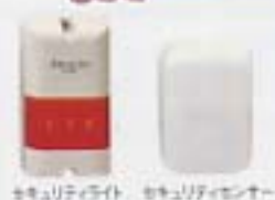
セキュリティライト セキュリティセンサー