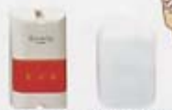
セキュリティライト セキュリティセンサー